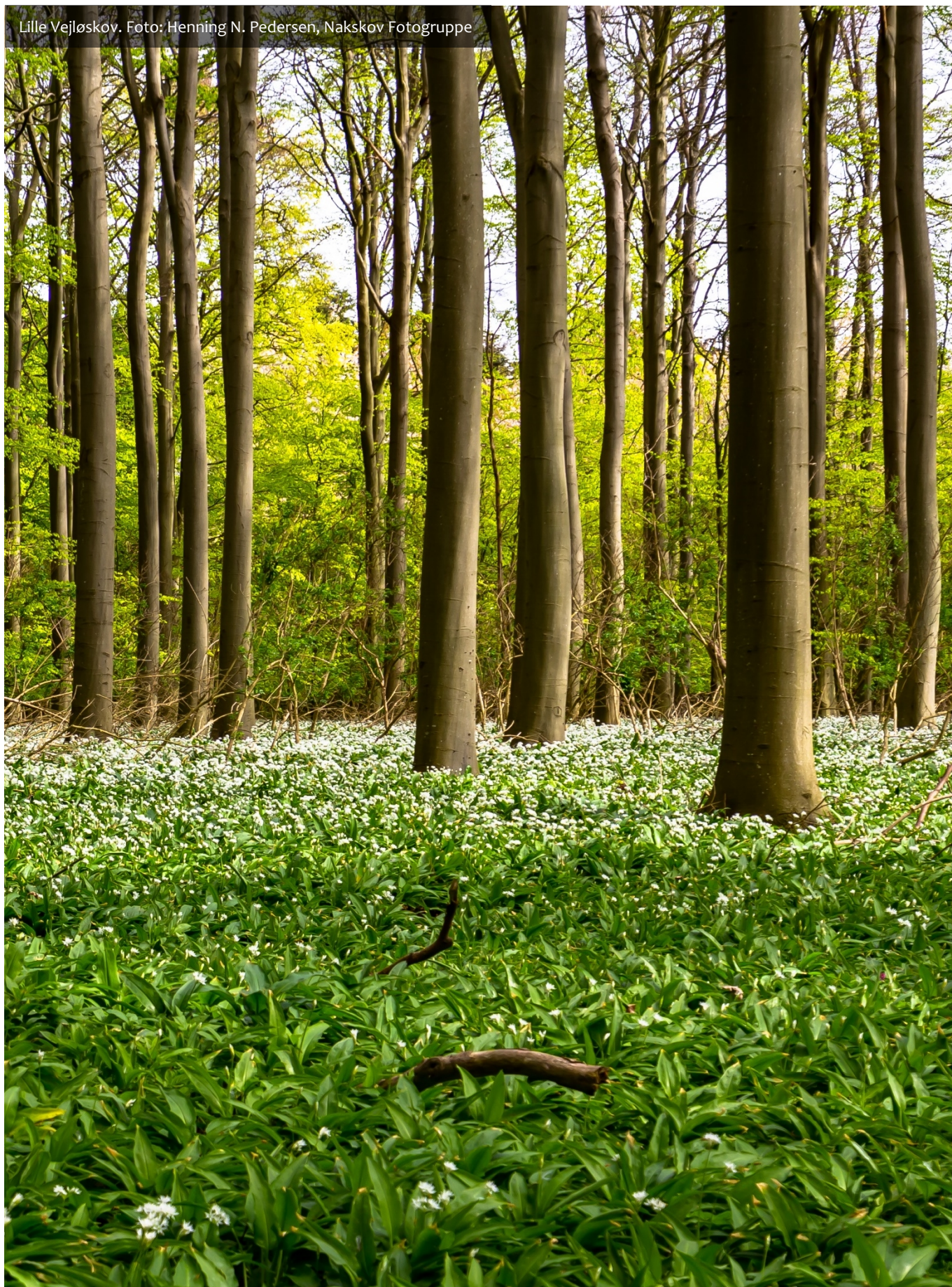
Lille Vejløskov.